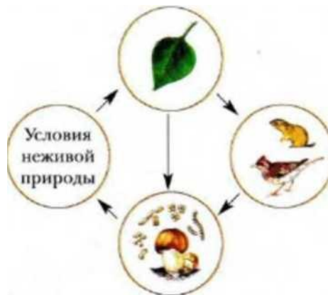
Рис. 2. Структура природного сообщества

В итоге такого взаимодействия условий абиотической среды и живого населения в биогеоценозе создается круговорот веществ и поток энергии: движение веществ и энергии из окружающей среды к одним организмам (растениям), от них — к другим организмам (различным гетеротрофам), а от них — вновь в окружающую среду.